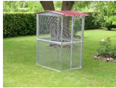
Voliera modello modulare

Gentile Cliente, grazie di aver acquistato un prodotto FERRANTI SRL.